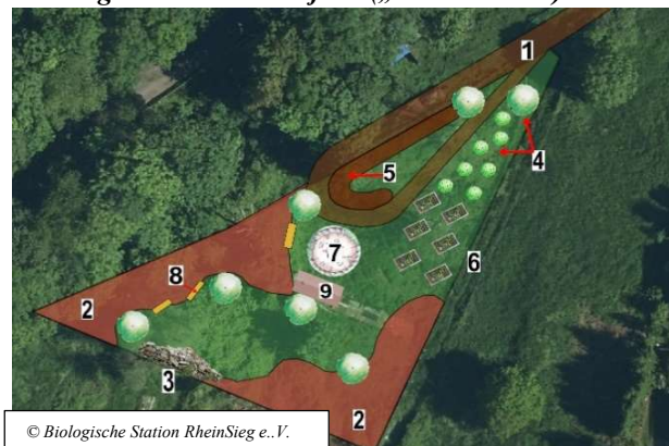
Brachgrundstück in Ließem („Himmelbeet“)

1 Insektenfreundliches Staudenbeet, 2 Spalierobst, 3 Gemüse/ Obst, 4 heimische Heckenbepflanzung