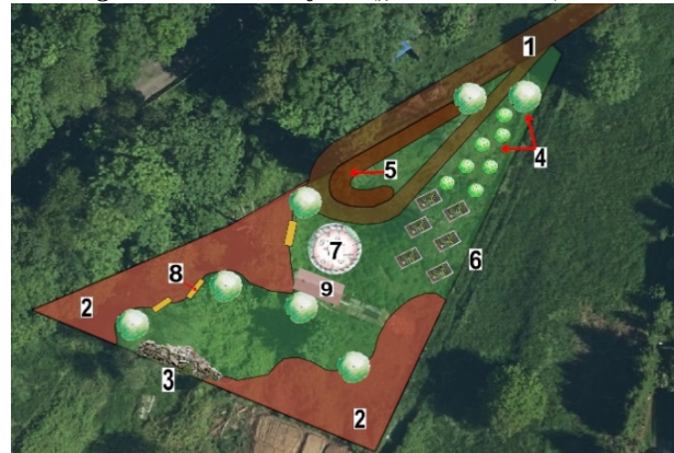
Brachgrundstück in Ließem („Himmelbeet“)

1 Zuwegung, 2 Spalierobst, 3 „Wilde Ecken“, 4 Obstbäume/-sträucher, 5 Hügelbeete, 6 Hochbeete, 7 Begegnungsplatz, 8 Insektennisthilfen, 9 Geräteschuppen